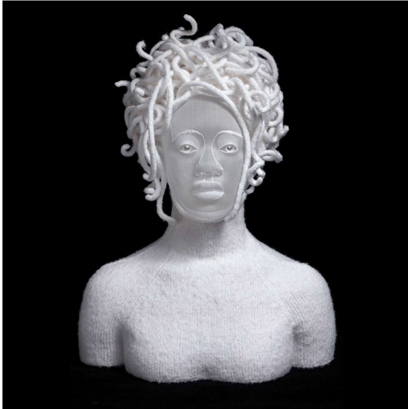
Angelique Médusa (67x50x40cm) 2018