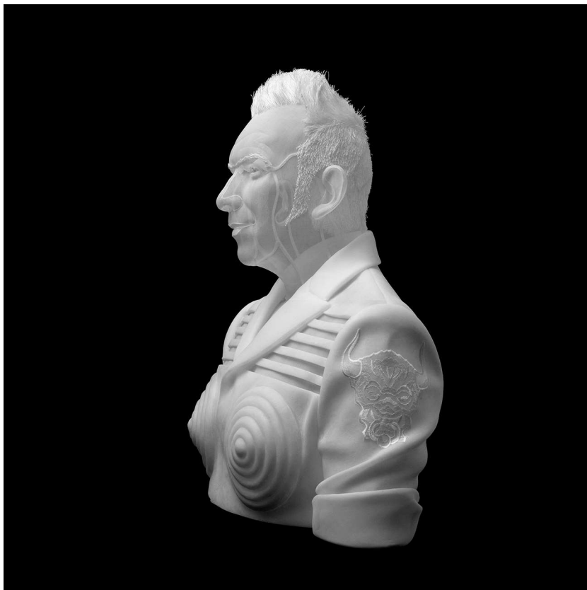
Angelique Jean Paul Gaultier (70x65x45cm) 2015