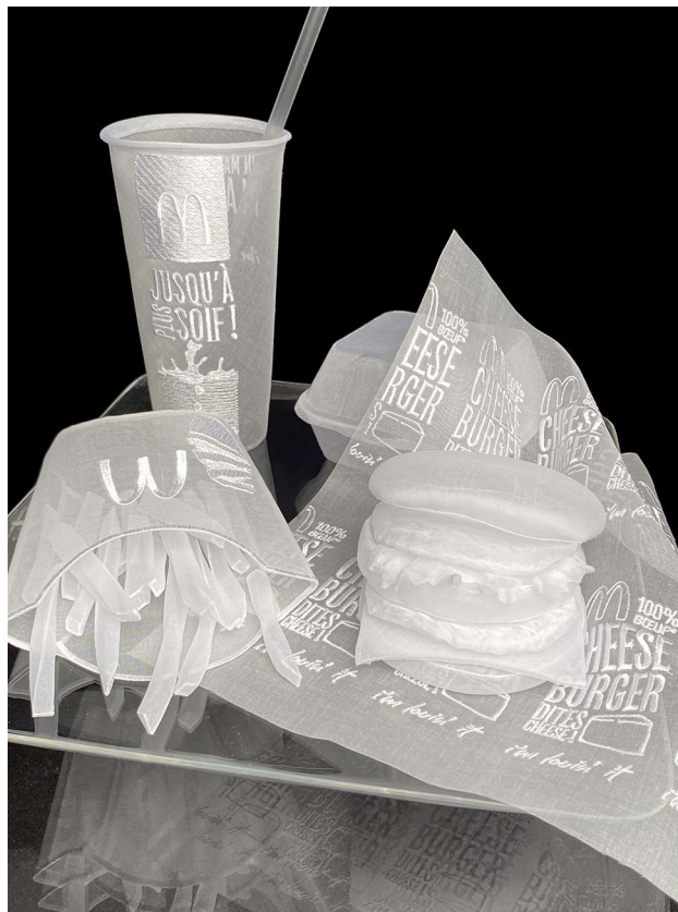
Angelique Mac Do II 2 (39 x39 x39cm) 2022