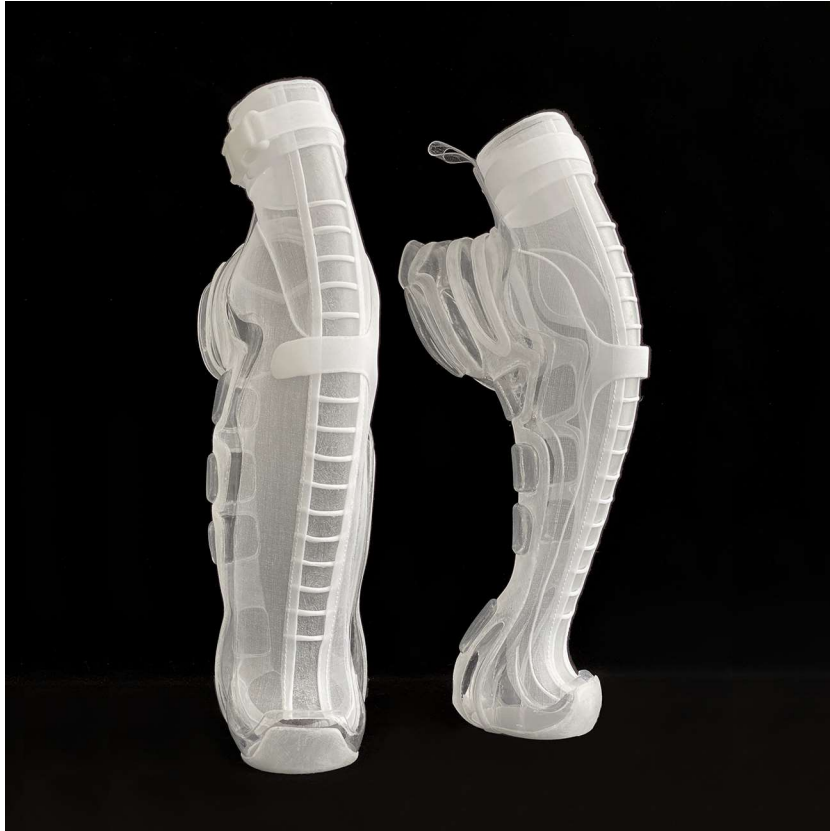
Angelique Baskets fétichistes ou Fantasma (45x33x33cm) 2021