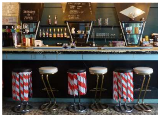
Cartes brodées avec des cheveux et rubalises - février 2022