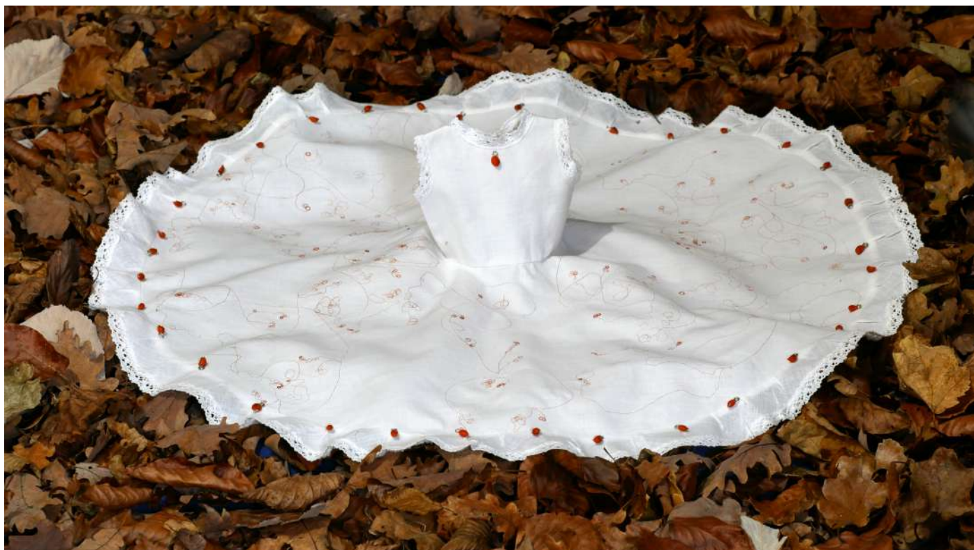
Broderie avec des cheveux sur une robe de poupée - graines de fusain d'europe en pendeloques - feuilles mortes hiver 2021

J'affectionne tout particulièrement les interactions et les croisements entre différents médiums artistiques. Ma pratique très centrée autour du cheveux ne m'empêche pas de mêler voix, sons, images, objets... d'utiliser différents savoir-faire ou de les partager d'autres artistes au gré des rencontres et des découvertes.