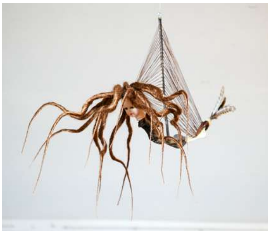
Cheveux en dreads, cheveux tressés - tête poupée porcelaine, branches et plumes

pour l'exposition " les feuilles bruissent sous les pas" - Galerie La rage - Lyon 07 - Hiver 2021