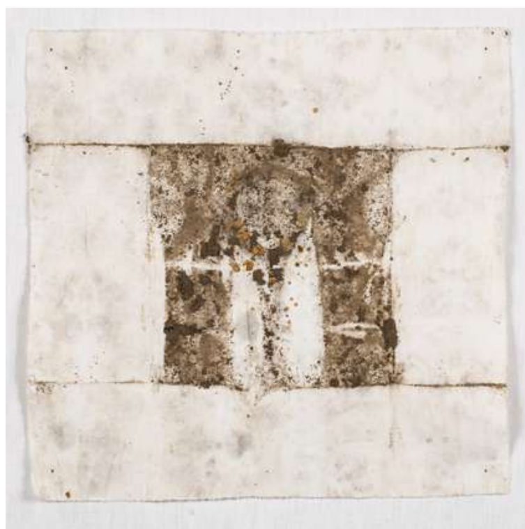
Drap de lit plié et enterré 29 jours - Déplié et brodé avec des cheveux