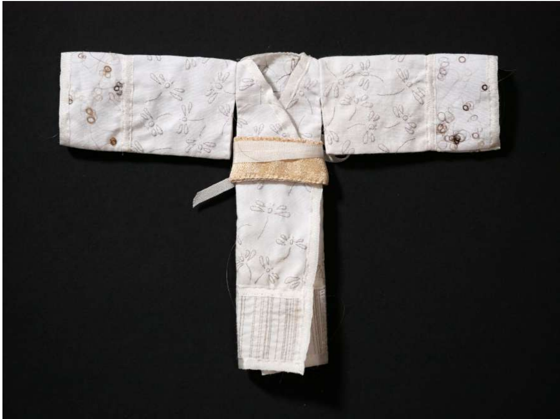
KIMONO - broderie avec des cheveux sur drap de lit, ceinture ancien kionono, ruban de soie, 11 x16 cm - devant printemps 2021

J'aime bien aussi les ouvrages à 4 mains.