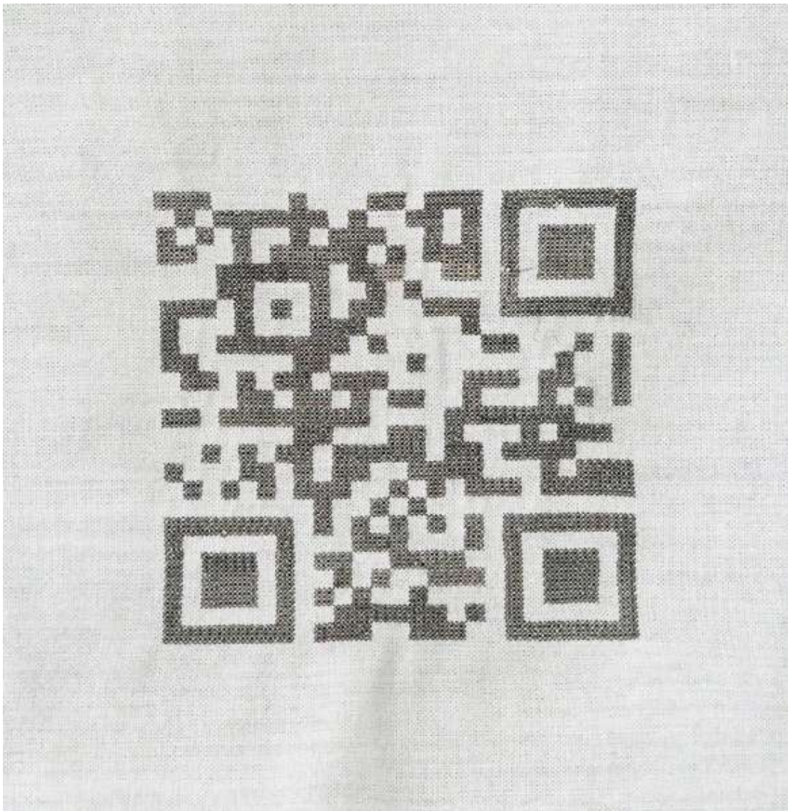
QR code "galerie corpus" - Broderie avec des cheveux sur drap de lit, 15x15 cm hiver 2022

J'aime compter, numéroter, les jeux de chiffres et de lettres, les codes secrets, les énigmes, les carrés, les labyrinthes, les formules mathématiques, les oscillations, les vibrations, les chemins de traverse, les souvenirs et les resouvenirs.