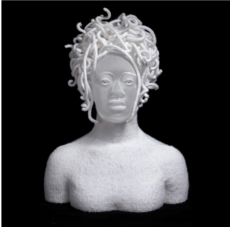
Angelique Médusa (67x50x40cm) 2018