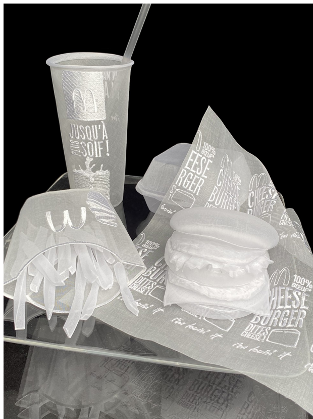
Angelique Mac Do II 2 (39 x39 x39cm) 2022