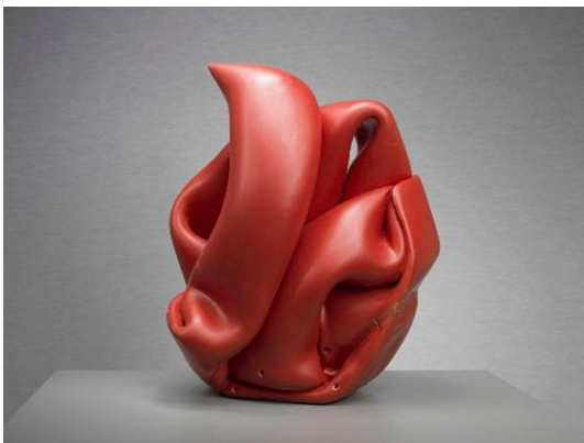
Catwalk , céramique

À travers ses pièces, Arlette Simon nous révèle ce qui se trame à l'intérieur des volumes sinueux qu'elle façonne. La céramique, sous ses mains, devient un terrain d'exploration infini, un langage de formes et de textures où chaque œuvre ouvre sur une multitude de possibles. Son travail, mêlant rigueur du geste et liberté de l'imaginaire, puise dans le minéral, le végétal et le mouvement. On y perçoit une dimension à la fois poétique et ludique : un jeu subtil de contrastes et d'équilibres, où chaque pièce semble prête à s'animer.