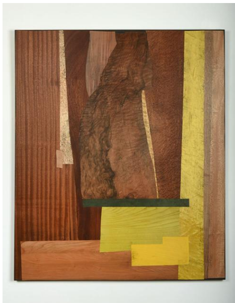
Failles, placages de bois