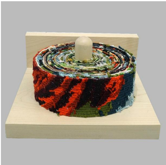
6,50 m de ruban de canevas sur sa petite étagère en frêne.

Depuis longtemps, l'art du texte et du textile sous toutes ses formes sont présents dans l'œuvre de Dominique Torrente. Elle qui a toujours considéré l'écriture, le dessin, la couture, la broderie comme des « semblables poétiques » plutôt que des pratiques rivales. [...] Les mots et la langue sont essentiels à sa création]. [...] Certaines œuvres construisent de nouvelles interactions, qui me font penser à Kurt Schwitters dans le « carambolage » des matières collectées, inspirées des chutes et rebuts à qui elle donne un nouveau cycle d'existence ; Comme dans les dessins « Plus de clarté (2021-2023) ou « Calice d'Apocalypse » (2023) qui démontre sa façon d'en découdre avec l'inquiétante étrangeté du réel...]. Elisabeth Chambon, conservateur en Chef Honoraire, texte d'introduction du catalogue de l'artiste, « Dans la trame de l'étoffe » 2025 « Penser sur le qui-vive ».