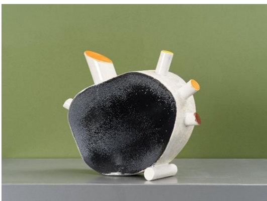
Temps modernes , céramique