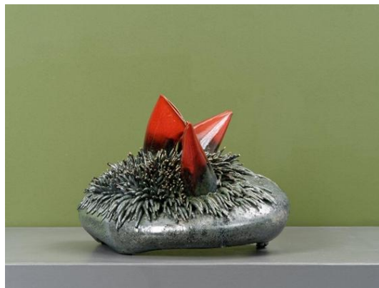
Lisière , céramique