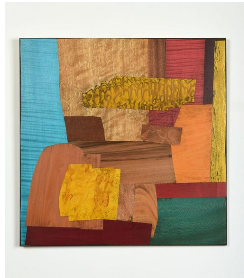
Hors cadre, placages de bois & laiton