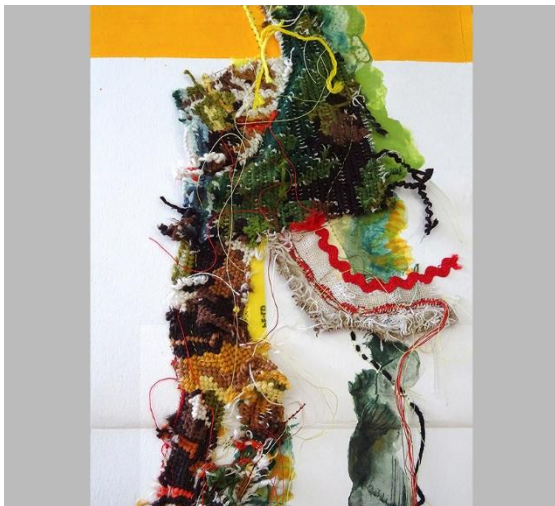
Quand les fils, les vrilles et les torsades s'emmêlent, ça fait des nœuds.