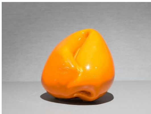
Berlingot , céramique

https://www.eaclesroches.com/arlette-simon/