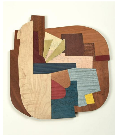
Bonbon, placages de bois